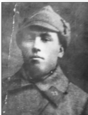
Уроженец села Троицкое Участник Великой Отечественной войны 1941 – 1945 годов