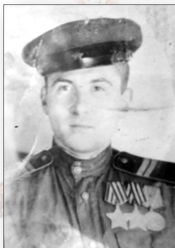
Уроженец села Троицкое Участник Великой Отечественной войны 1941 – 1945 годов