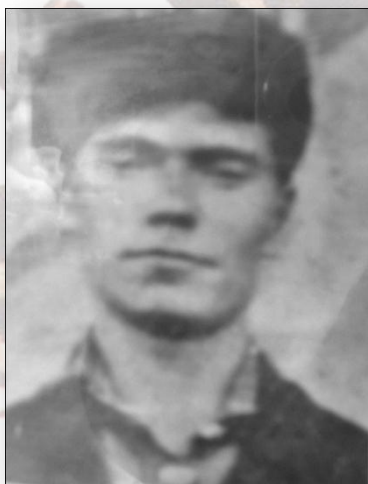
Уроженец села Троицкое Участник Великой Отечественной войны 1941 – 1945 годов