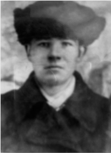
Уроженец села Троицкое Участник Великой Отечественной войны 1941 – 1945 годов