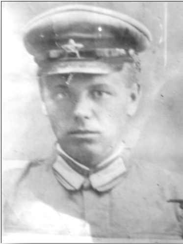
Уроженец села Троицкое Участник Великой Отечественной войны 1941 – 1945 годов