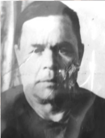
Год рождения: 1913 год Уроженец села Троицкое Сержант Призван в 1941 году Вернулся с Победой в 1945 году