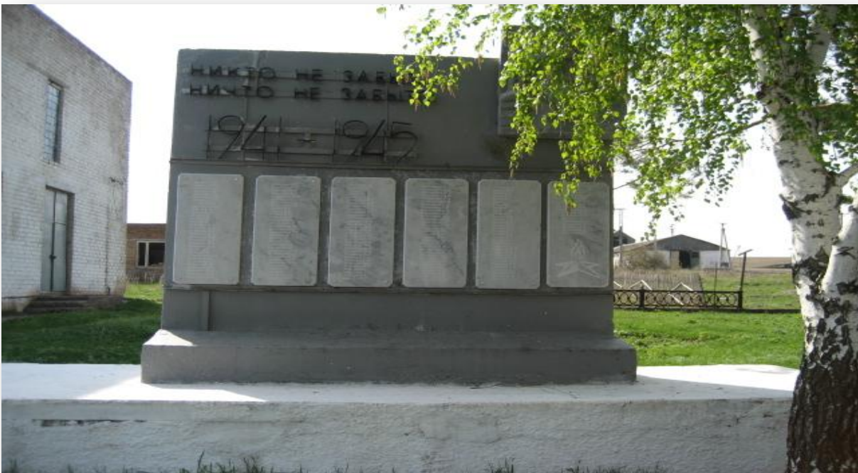
Памятник воинам, погибшим в Великую Отечественную войну село Троицкое

Воины - защитники села Троицкое [Текст]: солдатская энциклопедия: библиографический указатель / Сост. Е. И. Любишева. - Троицкое, 2010. - 62 с.