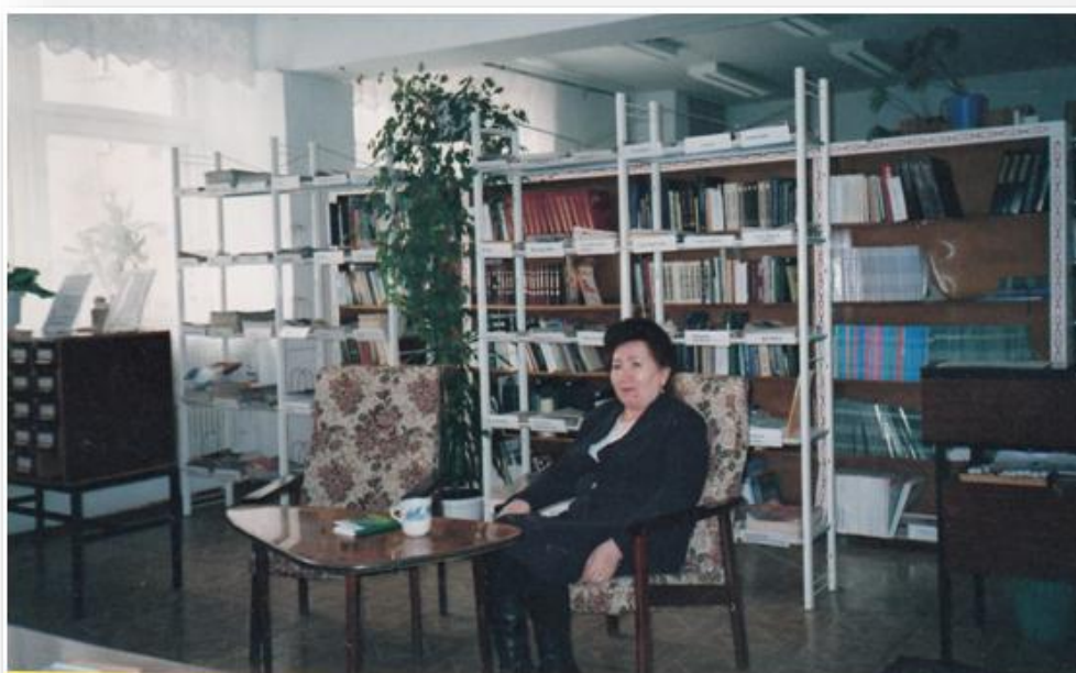
2007г. Литературный вечер-встреча с писательницей Тансулпан Гариповой