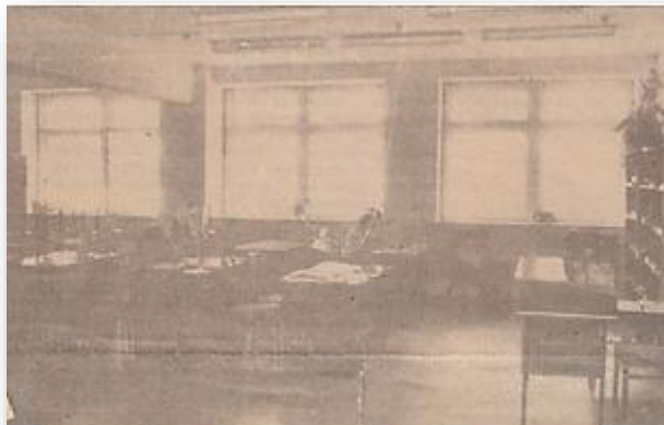
Вот такой читальный зал