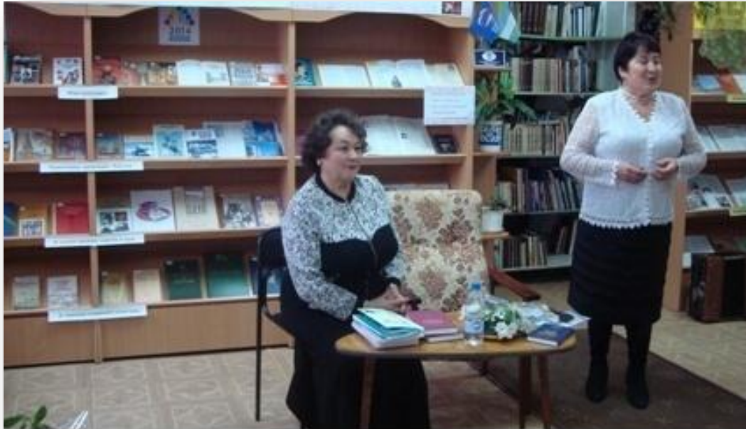
2014 г. Вечер-встреча с поэтессой Г.А.Юнусовой