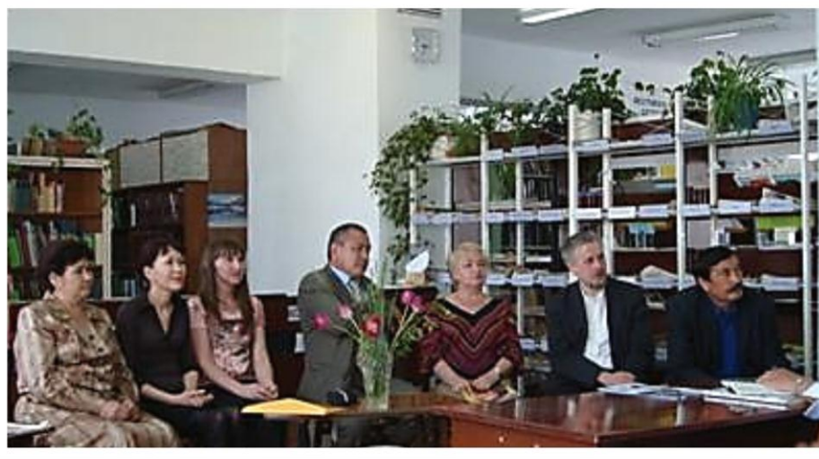
2.06.2009 г. День периодики. Встреча с представителями редакций журналов и газет РБ.