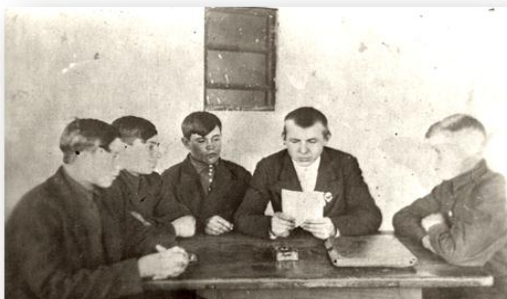
Комсомольцы села Воскресенское. Фото 1925 год