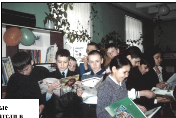
Юные читатели в библиотеке