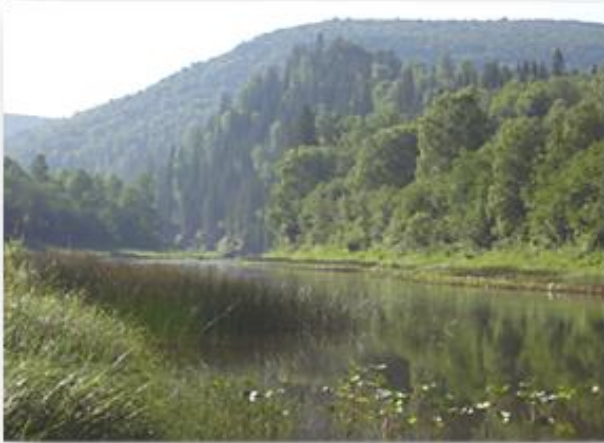
На берегах Нугуша

словесного изображения, близость к традициям народного творчества, поиски стихотворных форм. Черты героев народного творчества и эпосов прослеживаются и самого Гали Ильясова.