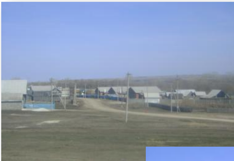
Деревня Давлеткулово Мелеузовского района. Фото 2011 г.

щедро одарила нашего земляка и все то, что он сделал, он делал с честью. Он любил так эту землю и все сущее на ней, так любил всю единую семью человечества и свой народ, так любил многоголосие планеты и клекочущее придыхание родного языка, и эта земля, и это человечества. В них и останется его душа.