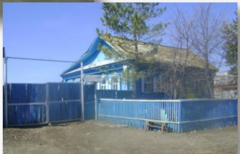
Родной дом Булата Рафикова. Фото 2011 г.