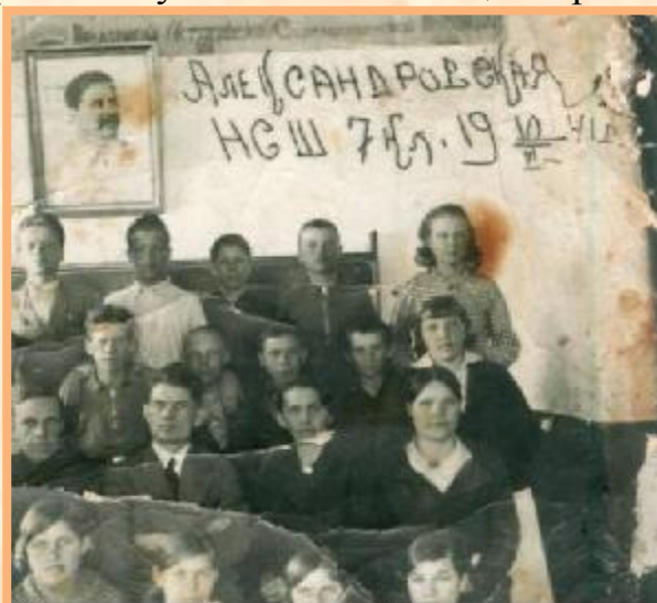
Выпускники Александровской семилетней школы Фото 10.03.1941 г.