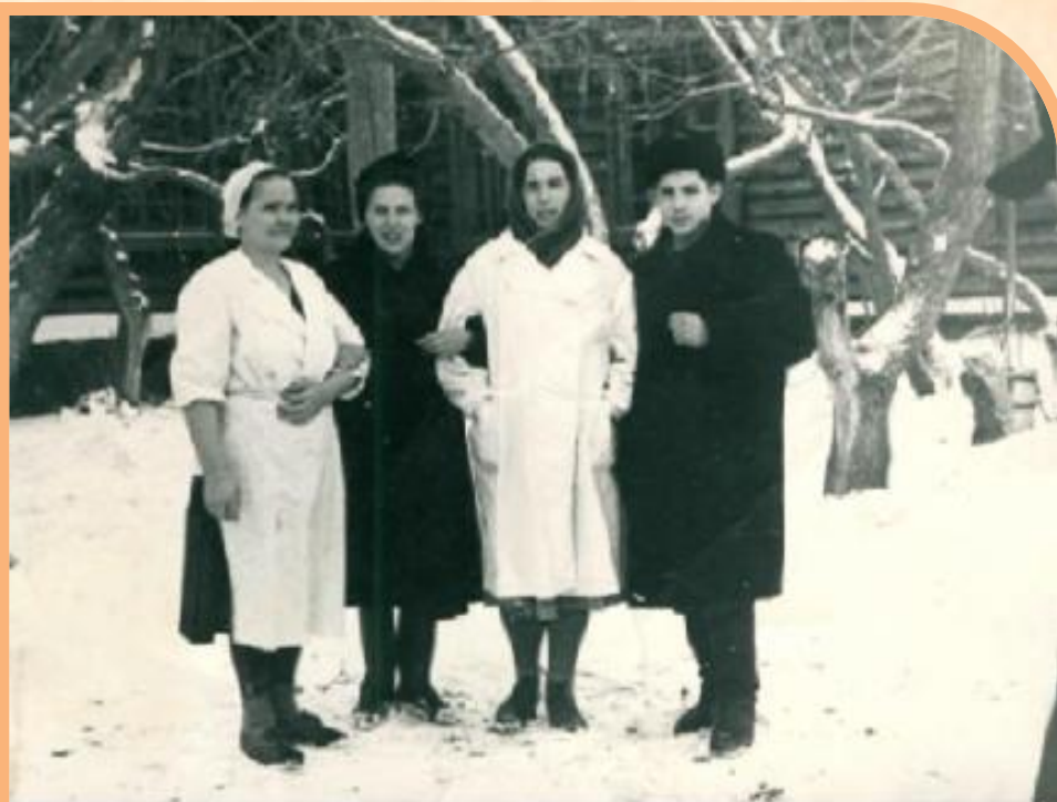
Коллектив детского дома Конец 50-х гг.

Мы жили практически, как в книге Макаренко, сами себя обеспечивали овощами, дровами. Старшие ребята готовили дрова в лесу, а мы, младшие, распиливали, кололи и складывали. Норма – 1