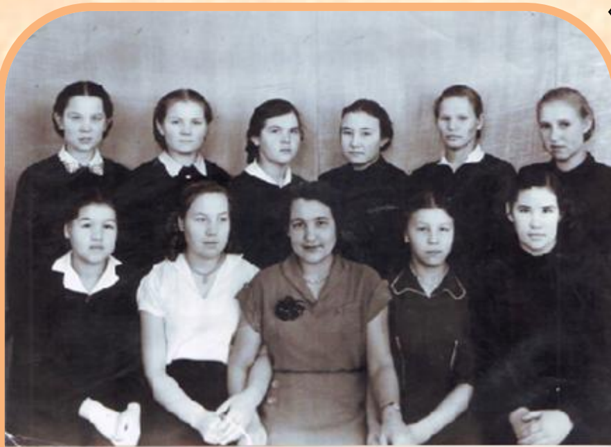
Воспитанницы Мелеузовского детского дома с воспитателем Фото конец 50 - х гг.

танцовщица. После детского дома она работала на молочно-консервном комбинате и ещё 2 года блистала на сцене РДК, затем уехала в Уфу. Чудакова Галина – активная участница художественной самодеятельности,