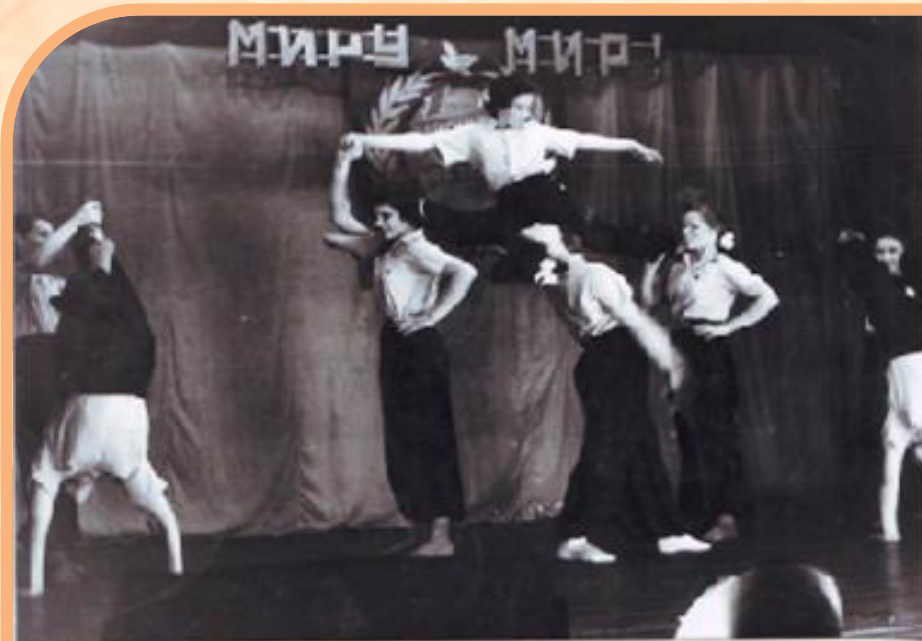
Воспитанники Мелеузовского детского дома на сцене ДК завода сухого молока, конец 50 - х гг.

Я с 1941 года рождения. Отец мой погиб в 1942 году, мама умерла в 1947 году. Сначала я воспитывалась в детском доме «Миякитаак» Миякинского района Башкирии. В 1951 году наш детский дом расформировали и меня перевели в детский дом рабочего посёлка Мелеуз, т. к. я плохо говорила по-русски, а в Мелеузе была семилетняя чувашская