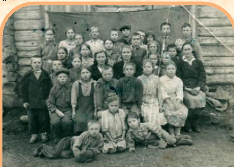
Коллектив педагогов и учащихся 5 класса сельской школы х. Вишневатский 1953 г.