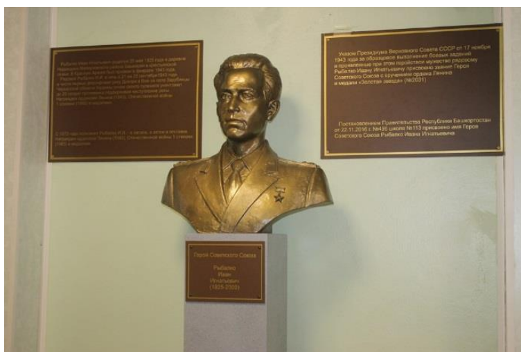
Бюст Ивана Игнатьевича Рыбалко в здании школы №113 Дёмского района

5 мая 2017 года бюст И. И. Рыбалко установлен в здании школы №113 Дёмского района, в которой учился герой.