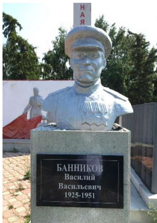
Бюст Полному Кавалеру орденов Славы, участнику ВОВ Банникову Василию Васильевичу

20 октября 2025 г. Постановлением Правительства Республики Башкортостан имя полного кавалера ордена Славы Василия Васильевича Банникова присвоено муниципальному общеобразовательному бюджетному учреждению средняя общеобразовательная школа села Зирган муниципального района Мелеузовский район Республики Башкортостан.