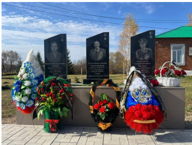
Мемориальный комплекс «Аллея Героев» в д. Сарышево