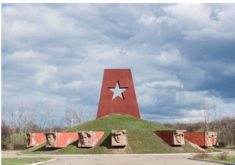
Памятник погибшим героям Красновки в Тарасовском районе Ростовской области