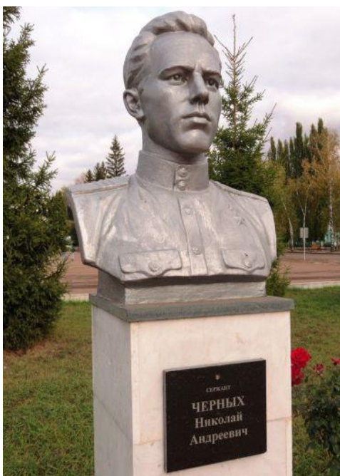
Бюст Н. А. Черных в г. Ишимбай

В 2022 г. Гимназии № 91 г. Уфы присвоено имя героя Советского Союза Николая Черных.